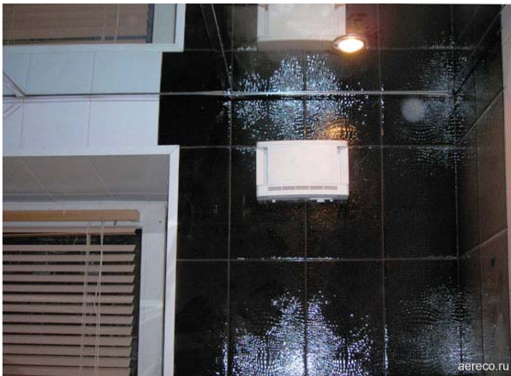
Стеновой приточный клапан ЕНТ обеспечивает до 40 м 3 /час при 10 Па.