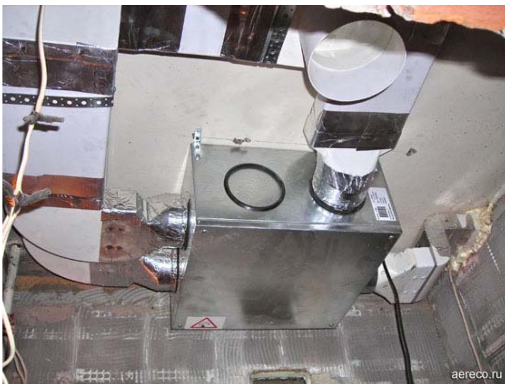
Вентилятор VAM обслуживает до шести вытяжных устройств и обеспечивает расход воздуха до 250 м 3 /час при 100 Па.