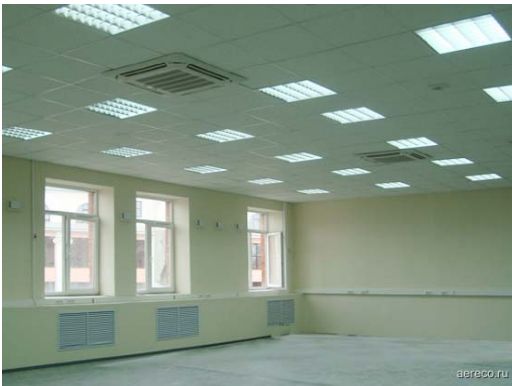
Помещение офиса банка с установленной вентиляцией и системой кондиционирования.