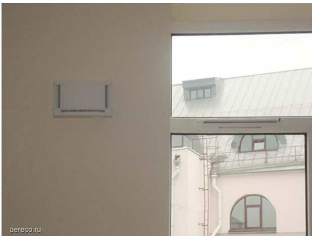
Сочетание приточных устройств (стенное – ЕНТ, оконное – ЕНА) позволяет обеспечить необходимый воздухообмен при ограниченных монтажных возможностях.